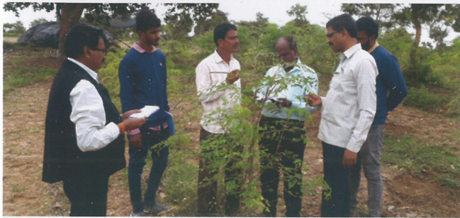
ಕೃಷಿ ಸಂಜೀವಿನಿ: Mobile Agri Horti Clinic : 3ನೇ ವಾರ ನಂಜನಗೂಡು ತಾಲ್ಲೂಕು ಕ್ಷೇತ್ರಭೇಟಿಯ ಛಾಯಾಚಿತ್ರ