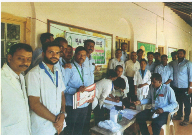
Health checkup by the doctor