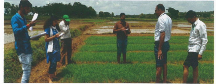
ಕೃಷಿ ಸಂಜೀವಿನಿ: Mobile Agri Horti Clinic : 6ನೇ ನಾರ ಪಿರಿಯಾಪಟ್ಟಣ ತಾಲ್ಲೂಕು ಕ್ಷೇತ್ರಭೇಟಿಯ ಛಾಯಾಚಿತ್ರ