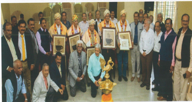
Guru vandana - Group Photo of ABC-75 batch with their teachers