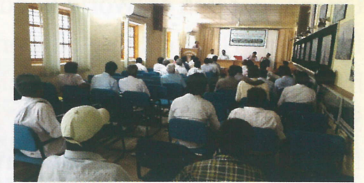
ಕೃಷಿ ಸಂಜೀವಿನಿ: Mobile Agri Horti Clinic : 4ನೇ ನಾರ ಟಿ.ನರಸೀಪುರ ತಾಲ್ಲೂಕು ಕ್ಷೇತ್ರಭೇಟಿಯ ಛಾಯಾಚಿತ್ರಗಳು