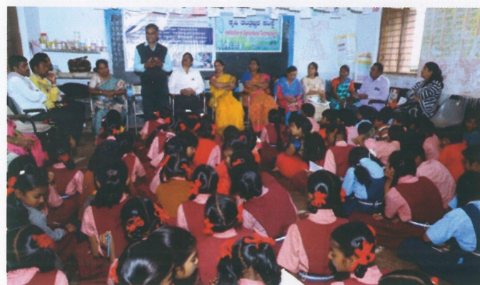
About IAT and its function by Dr.S.S.Dolli