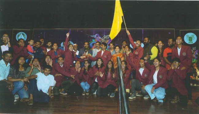
ಅಗ್ರಿಯಾನಿಫೆಸ್ಟ್ - ಚಾಂಪಿಯನ್ ಪ್ರಶಸ್ತಿಗಳಿಸಿದ ಬಾಗಲಕೋಟೆ ತೋಟಗಾರಿಕಾ ವಿಶ್ವವಿದ್ಯಾಲಯದ ವಿದ್ಯಾರ್ಥಿಗಳು